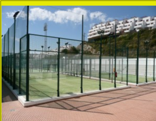
PISTAS DE PADEL - Pabellón Cubierto Municipal