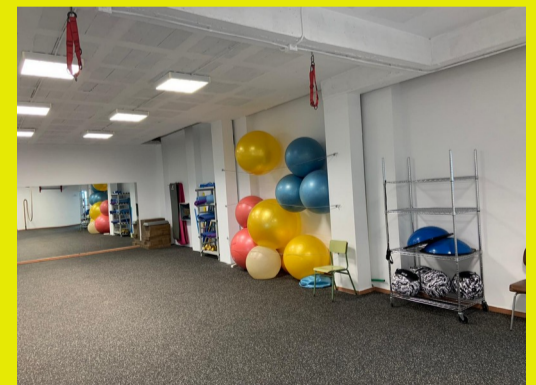
SALA ESPEJOS - Pabellón Cubierto Municipal