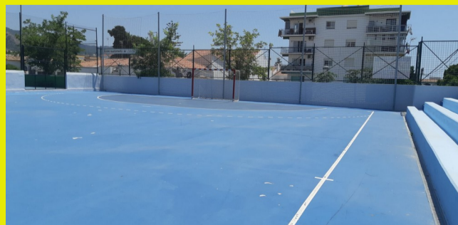
PISTAS FÚTBOL SALA - Polideportivo Municipal