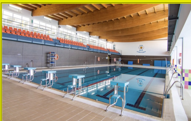
PISCINA - Pabellón Cubierto Municipal