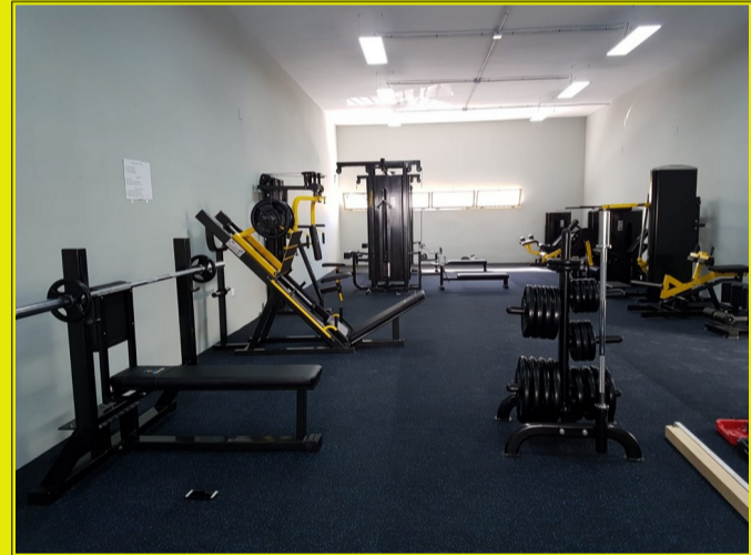
SALA GIMNASIO ATLETISMO - Estadio Enrique López Cuenca