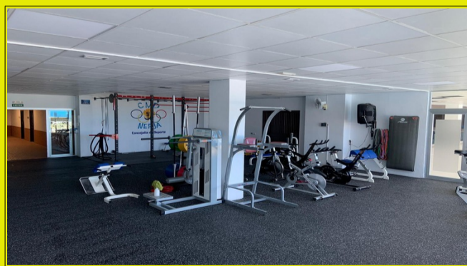
SALA GIMNASIO - Pabellón Cubierto Municipal