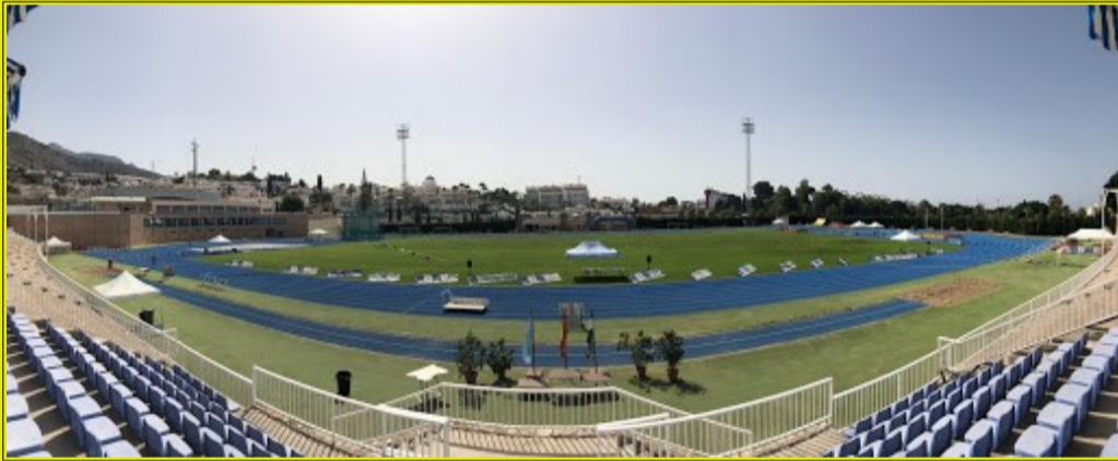
PISTAS DE ATLETISMO - Estadio Enrique López Cuenca